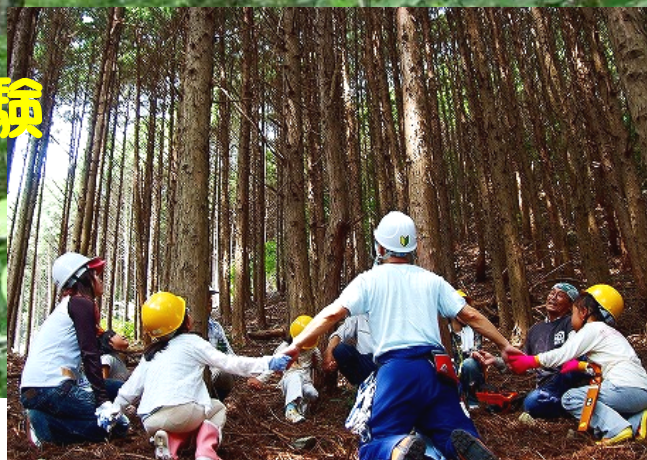
〈愛知県岡崎市鳥川小学校の森の健康診断〉